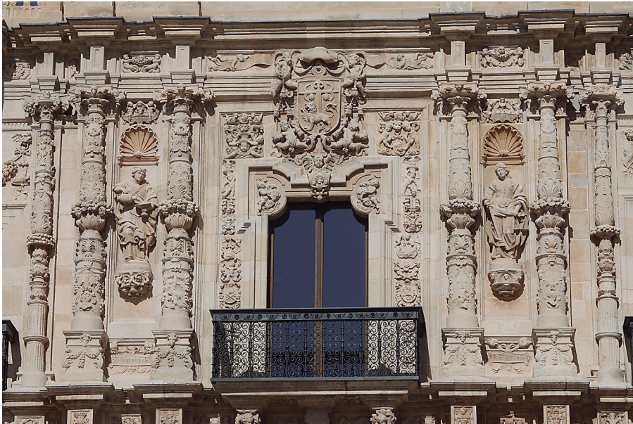
Convento de San Marcos, León

religiosos como civiles y se identifica por una abundante y minuciosa decoración compuesta de grutescos, medallones, elementos heráldicos, conchas, etc. Su profusa decoración, elaborada con gran delicadeza y detalle, recuerda la labor realizada por los plateros, de ahí su denominación.