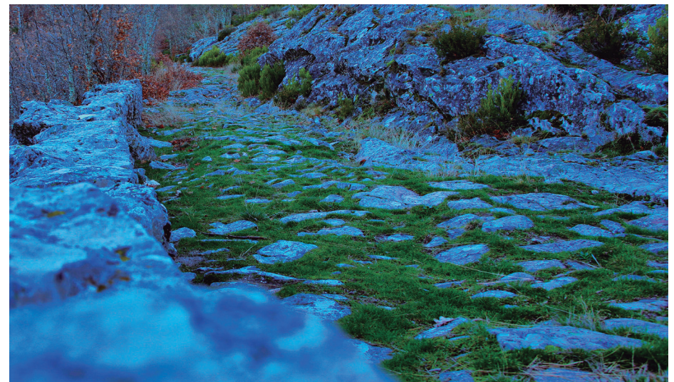
Calzada romana. Villayandre