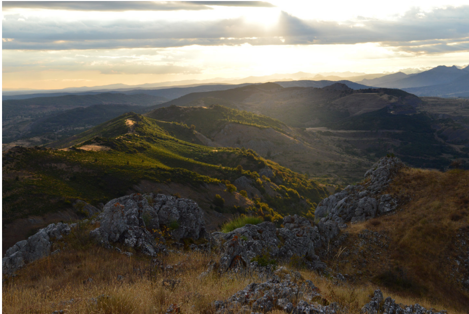
Vistas desde Yugueros

A este amplio patrimonio histórico-artístico, junto al repertorio notable de otras obras de arte que albergan estas iglesias mencionadas, hay que sumar el que ofrecen la naturaleza y las tradiciones de estas localidades y sus entornos inmediatos, entre otros muchos atractivos. Podrá observar en relación al paisaje un gran contraste entre las amplias llanuras en el entorno de Sahagún, Gordaliza y Vallecillo y la montaña que acoge las localidades de Cistierna y Yugueros.